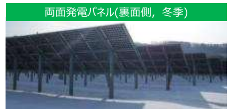
両面発電パネル(裏面側, 冬季)