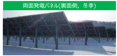
両面発電パネル(裏面側, 冬季)