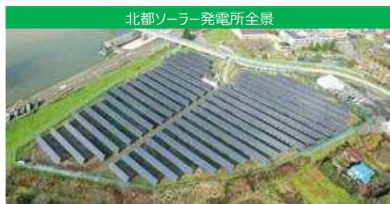
北都ソーラー発電所全景