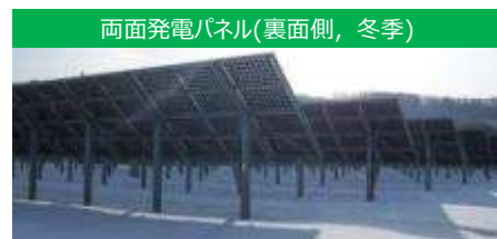
両面発電パネル(裏面側, 冬季)