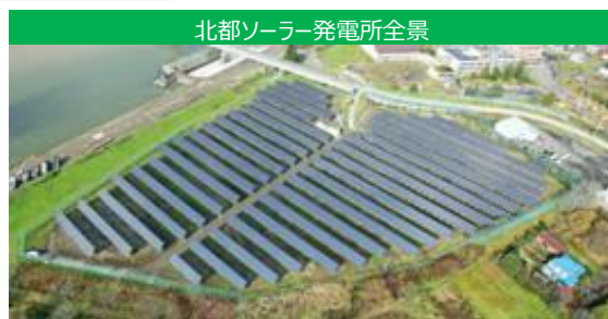
北都ソーラー発電所全景