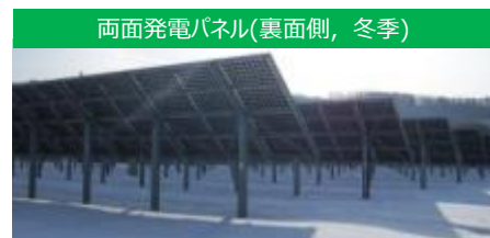
両面発電パネル(裏面側, 冬季)